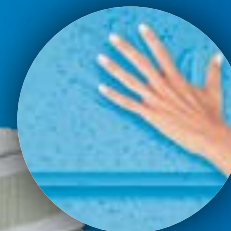
Eternity matrac dupla Cool ViscoGel réteggel