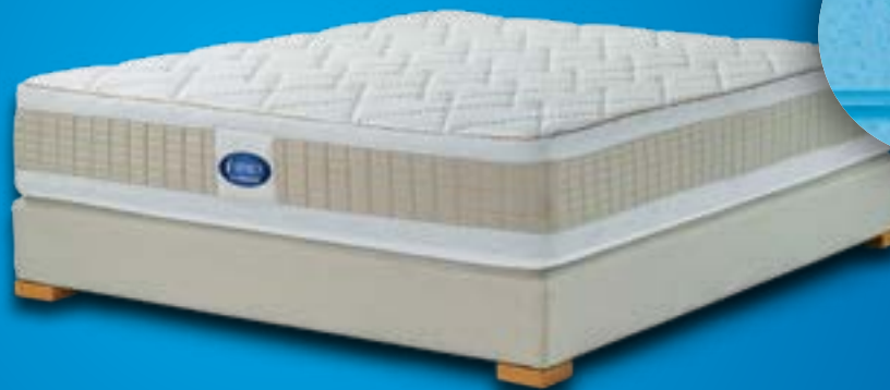
Eternity matrac dupla Cool ViscoGel réteggel