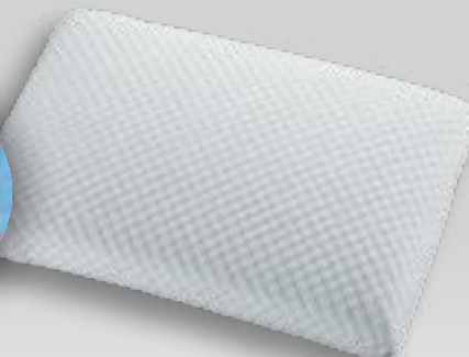
Cool ViscoGel réteggel