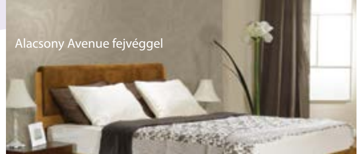
Alacsony Avenue fejtéggel